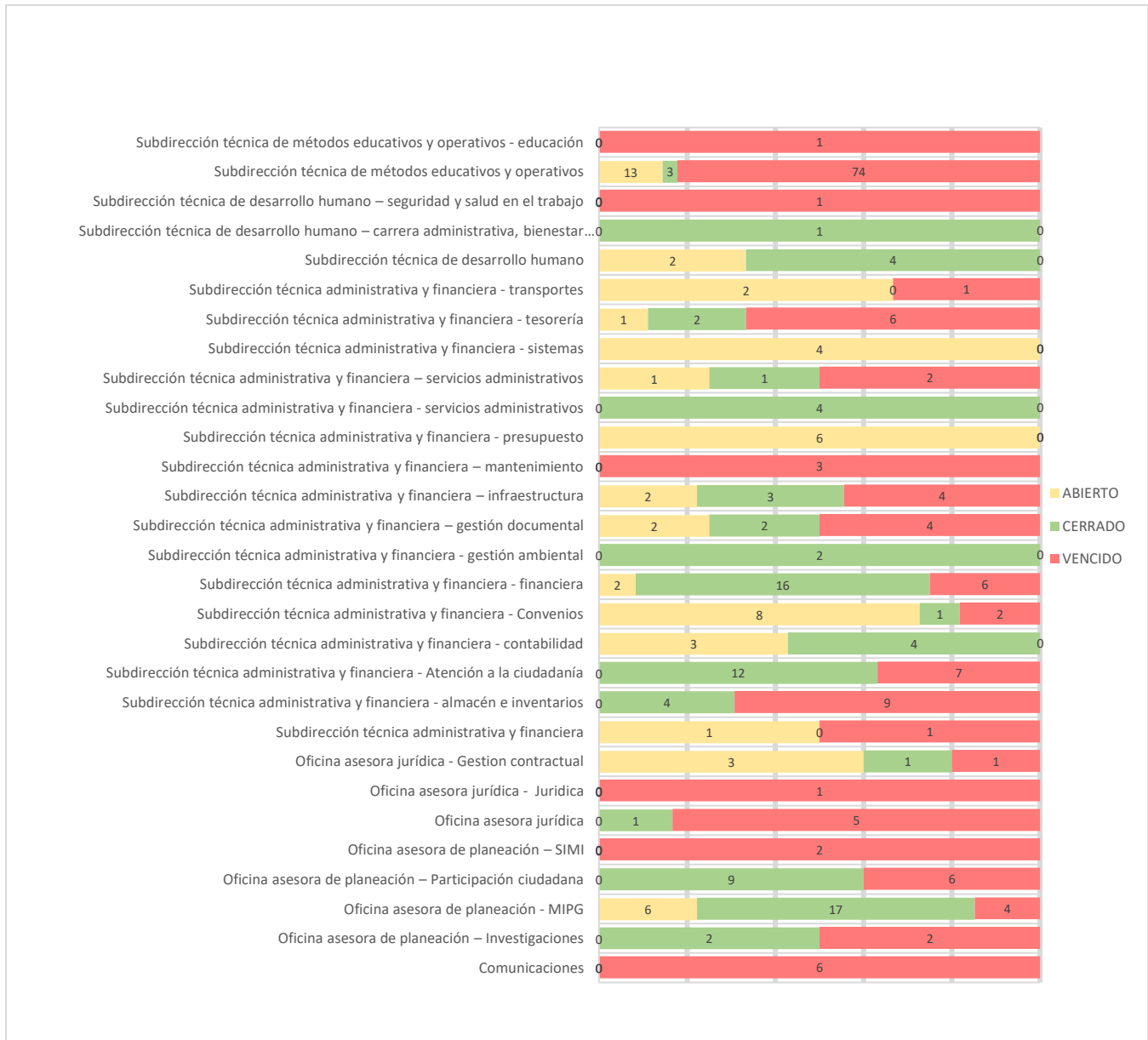
Gráfico 2. Participación porcentual por proceso cierre de acciones de mejora - Elaboración OCI. Fuente: tablero de control