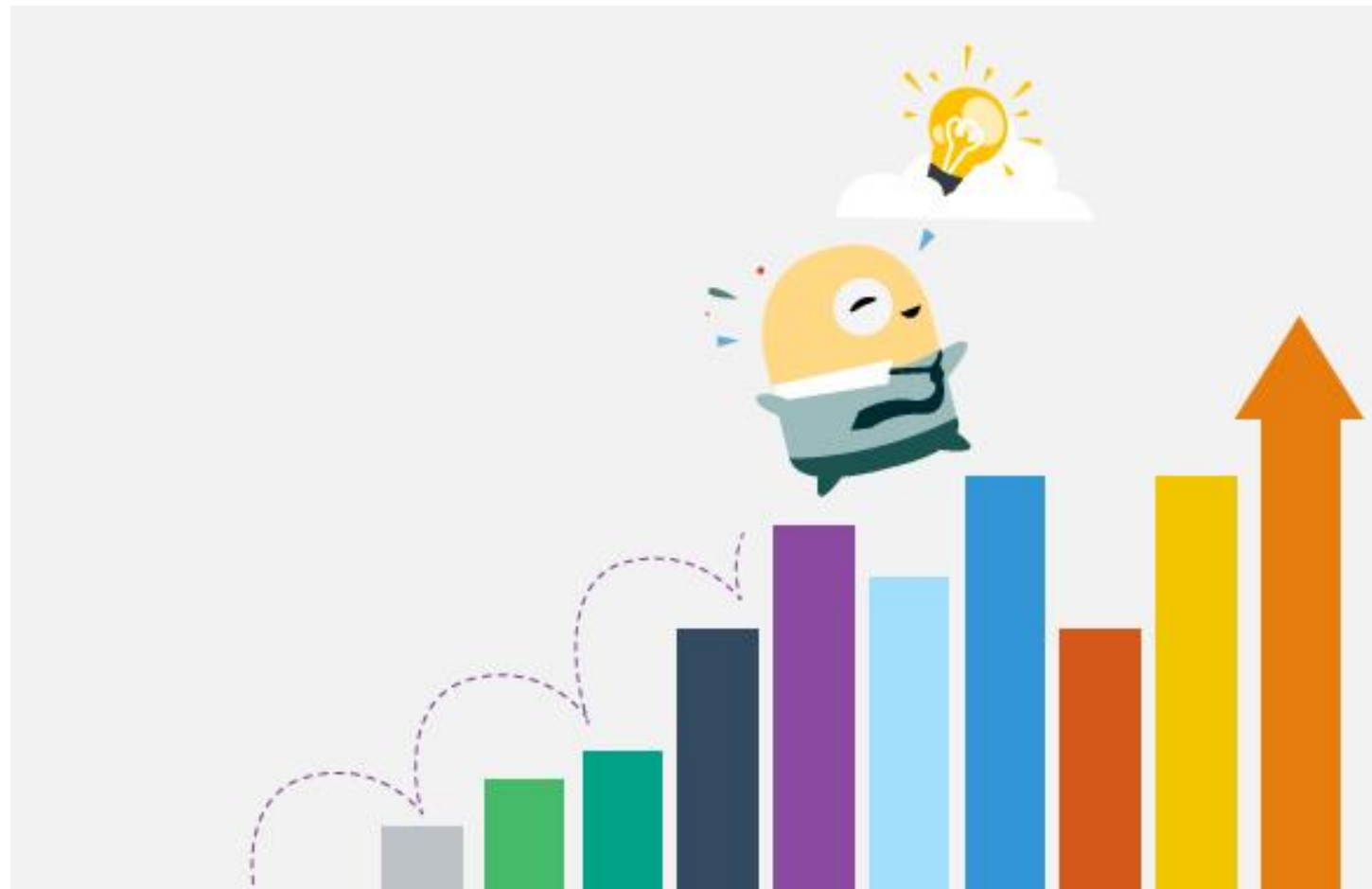
Mujeres, Personas Con Discapacidad, Víctimas del Conflicto Armado, Pertenencia Étnica, Lesbianas, gays, bisexuales, trans