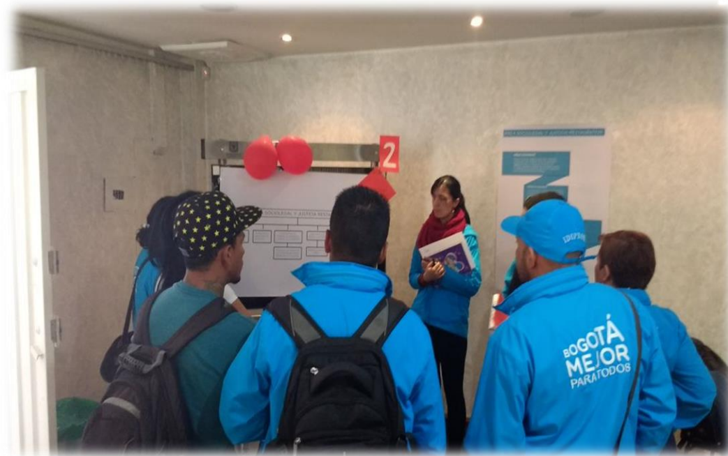
Atenciones Jurídicas según Rama del Derecho